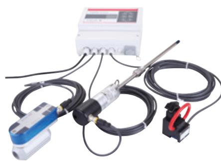
Obr.3: SONOAIR TIM s připojenými průtokoměry a elektroměrem