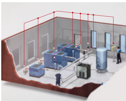
Obr.2: Monitorování kompresorovny se SONOAIR TIM